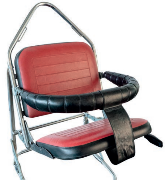
First child car seat Niki from 1963

Und es bleibt spannend beim Erfinder des Kinderautositzes, denn neben Niki start (M), Niki kid und Niki next befinden sich weitere Entwicklungen in den Startlöchern. Als nächstes Highlight ist die Babyschale Niki new geplant, die mit ihrem hohen Komfort und den praktischen Features entspannte und sichere Autofahrten mit Kind & Kegel garantiert. Junge Familien können sich außerdem auch schon jetzt auf den stylischen Kombi-Kinderwagen Nik freuen. So wachsen auch zukünftige Generationen gemeinsam mit Storchenmühle und glücklichen Kindheitserinnerungen auf.